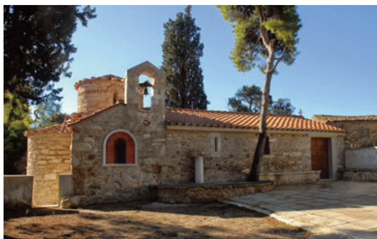
Κάθε Σάββατο θα λειτουργεί ο Ιερός Ναός των Εισοδίων της Θεοτόκου στο κτήμα των Τραχώνων.

Όπως είναι γνωστό η τώως Διοίκηση της ΜΑΚΡΟ είχε αποκλείσει την τοπική κοινωνία να επισκέπτεται για θρησκευτικούς, εκπαιδευτικούς και πολιτιστικούς λόγους τον Βυζαντινό Ναό του 12ου αιώνα των Εισοδίων της Θεοτόκου στο κτήμα Τραχώνων στον Άλιμο. Απαγόρευε την είσοδο στον Ναό σε μαθητές, εκπαιδευτικούς και κατοίκους. Δεν επέτρεπε την είσοδο σε εκπαιδευτικούς να υλοποιήσουν περιβαλλοντικά προγράμματα, στο ανοικτό ρέμα των Τραχώνων. Η Διοίκηση της ελληνικής εταιρείας "ΣΚΛΑΒΕΝΙΤΗ" η οποία πρόσφατα εξαγόρασε τη ΜΑΚΡΟ κατήργησε όλα τα υφιστάμενα εμπόδια. Σε συνάντηση, που πραγματοποιήθηκε στα γραφεία της εταιρείας, με-