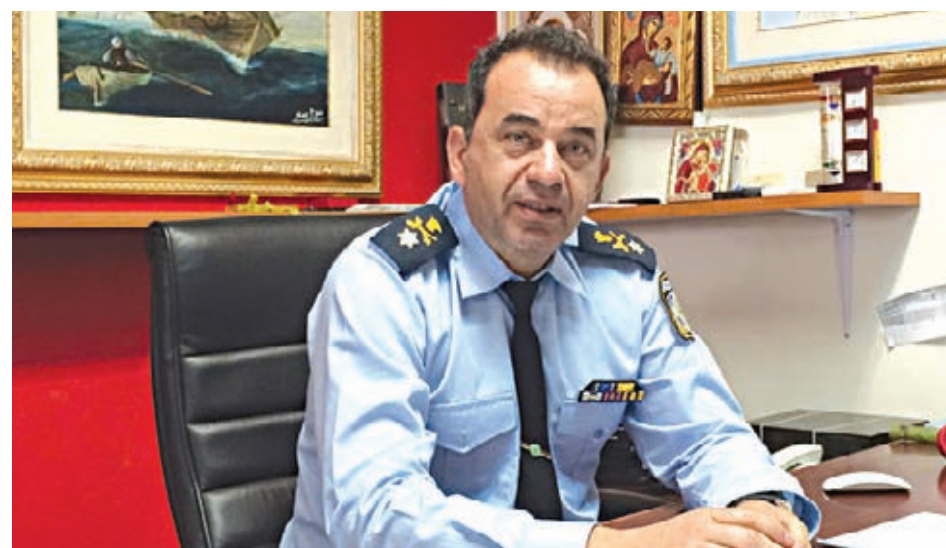
Ο Διευθυντής της Ν/Α Αττικής Ταξίαρχος Λουκάς Τουρνέτας.

Αποτέλεσμα της συνεργασίας αυτής είναι ο περιορισμός και η εξάλειψη φαινομένων που διετάρασσαν την ειρηνική διαβίωση των κατοίκων στις τοπικές κοινωνίες, όπως η αντιμετώπιση της πορνείας στην περιοχή του Αλίμου, η εξάρθρωση συμμοριών ανηλίκων καθώς και "πορτοφολάδων" και "τσαντάκηδων" στην περιοχή της Γλυφάδας, καθώς και η αντιμετώπιση των φθορών,