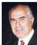
ΡΕΠΟΡΤΑΖ: ΝΙΚΟΛΑ ΚΟΝΤΑΡΙΝΗ

Όπως κάθε φορά, έτσι κι εφέτος, στο Παλαιό Φάληρο γιορτάστηκε με ιδιαίτερη λαμπρότητα η Εθνική Επέτειος της 25ης Μαρτίου 1821, με την επίσημη δοξολογία που τελέστηκε στον Ιερό Ναό Αγίου Αλεξάνδρου, την κατάθεση στεφάνων στο Μνημείο Πεσόντων Ηρώων και, ακολούθως, με την εντυπωσιακή παρέλαση στην παραλιακή Λεωφόρο Ποσειδώνος, την οποία παρακολούθησαν χιλιάδες δημότες.