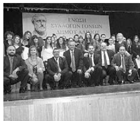
Από τη βράβευση αριστούχων, έτους 2012.

Αυτά που μας αναπτύσσετε μας θυμίζουν τους λόγους της πρόσφατης παραίτησης του κ. Ανδρέα Κονδύλη. Ποια είναι η άποψή σας για την ανεξαρτητοποίησή του;