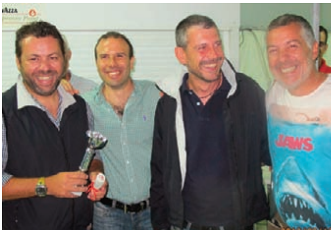
Από τις απονομές των επάθλων στους νικητές.