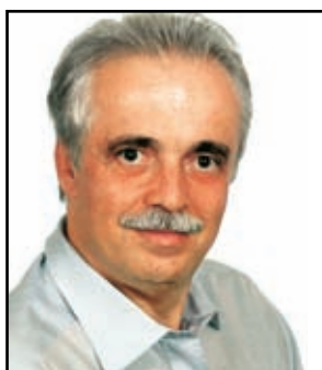
ΓΡΑΦΕΙ Ο ΔΗΜΗΤΡΗΣ ΚΑΡΑΠΑΝΟΣ

Είναι γνωστό ότι έναντι της διελεύσεως του τραμ από την πόλη μας, ο Δήμος Γλυφάδας μετά από ένα άγριο παρασκηνίο υπόγειων συμφωνιών, ύποπτων συναλλαγών, απειλών και τελικά συμβιβασμών μεταξύ Δημοτικών παραγόντων, κυβερνητικών παραγόντων, διαπλεκομένων πολιτι-