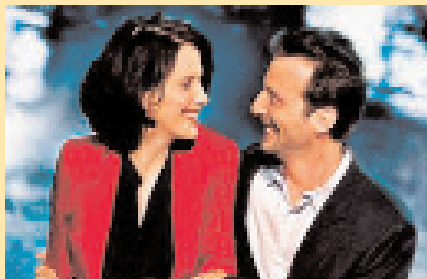
"Η Ζωή μιας Άλλης"