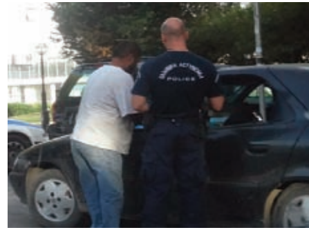
Αστυνομικοί του Α.Τ Βούλας κατά την διάρκεια ελέγχου

Το συγκεκριμένο μοντέλο καλείται να το εφαρμόσει και να δώσει τις ανάλογες κατευθύνσεις, ο καινούργιος αστυνομικός διευθυντής Νοτιο-Ανα-