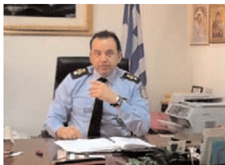
Ο αστυνομικός διευθυντής Νοτιο-Ανατολικής Αττικής ταξίαρχος Λουκάς Τουρπέτας

Αυτή η αναγκαιότητα υπήρξε ιδιαίτερα πιεστική για τα μεγάλα αστικά κέντρα όλων των ανεπτυγμένων δημοκρατικών κοινωνιών, όπου η ανωνυμία του πλήθους σε συνδυασμό με την αύξηση της μικροεγκληματικότητας (κλοπές, διαρρήξεις, συμπλοκές με τραυματισμούς και υλικές ζημιές, κλπ) προκαλούν ανασφάλεια και γενικά κυριαρχεί στο κοινό ο φόβος του εγκλήματος.