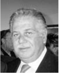
ΓΡΑΦΕΙ Ο ΝΙΚΟΣ ΓΙΑΝΝΙΟΣ

Τ ουρκία. Ότι απέμεινε από την άλλοτε κραταιά αυτοκρατορία που με την διάλυσή της επέτρεψε την δημιουργία των νέων εθνικών κρατών της Βαλκανικής και της Μέσης Ανατολής δεν είναι παρά εκείνο που κατακράτησε το σουρωτήρι. Ένα ίζημα περισσοτέρων των 60 εθνικών και θρησκευτικών μειονοτήτων, το οποίο ανεπιτυχώς επεχείρησαν οι Νεότουρκοι να το μετατρέψουν σε Εθνικό Κράτος. Καταπίεσαν, βίασαν και σκότωσαν αλλά και πάλι δεν τα κατάφεραν.